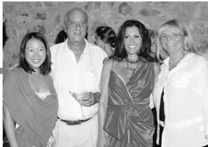
Η Μπέ Φανγκ αν. υφ. Εξωτερικών των ΗΠΑ, ο Αδαμάντιος Πολέμης με τη σύζυγό του Ηλιάννα Σαντρατζέμη (αδελφή της Τζο Τόγκου) και η Μαίρη Γκάμπριελ-Κοντού